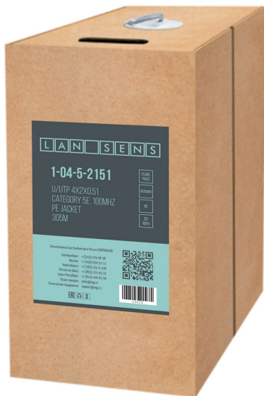
Рисунок 1 - Упаковка